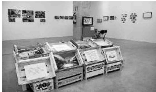
Parte de la instalación del colectivo PEC.