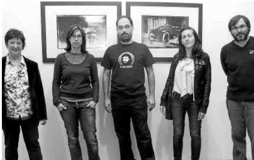
Pasado y presente se reúne en el Depósito de Aguas.